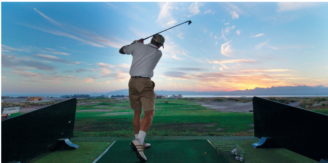
Herrliche Golfplätze erwarten Sie auf dieser Reise!

Sofort-Preis – beschränkte Verfügbarkeit! 10% Rabatt, bis Fr. 380.– günstiger