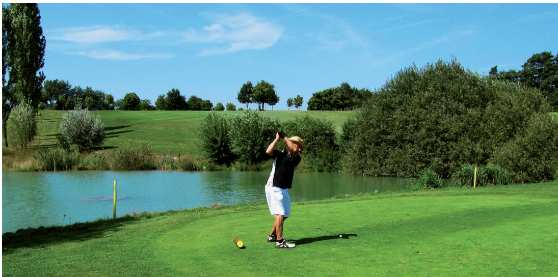
Golf at its best

Sofort-Preis – beschränkte Verfügbarkeit! 15% Rabatt, bis Fr. 525.- günstiger