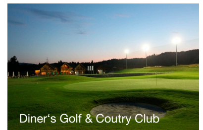
Diner's Golf & Coutry Club